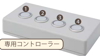
専用コントローラー